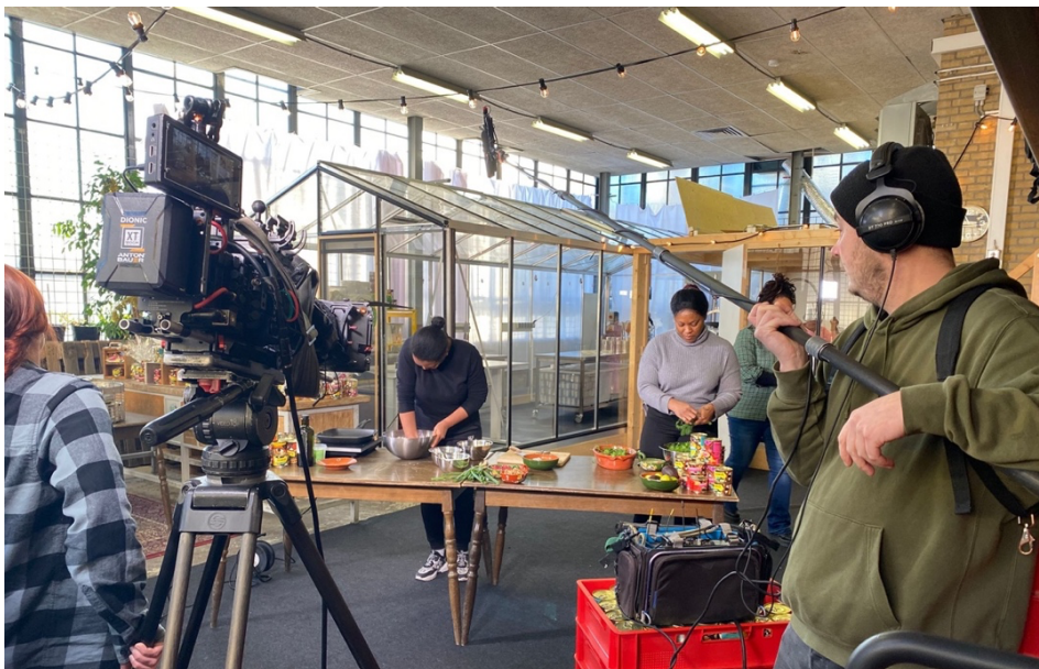
Opnames van Binnenste Buiten in december 2022